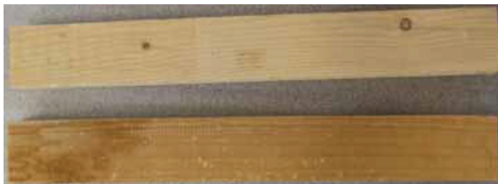
2 Holzstücke 40 cm lang

Wenn folgende Teile vor Ihnen liegen, ist die Transportsicherung entfernt.