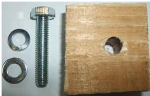
Schraube (Sechskant) M8 x 40 U-Scheibe M8 Federring M8 Verstärkungsholz 50 x 50 x 25 mm