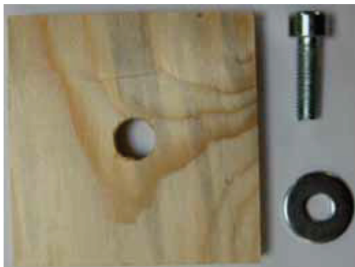
Verstärkungsholz 60 x 60 x 8 mm Zylinderkopfschraube (Imbus) M6 x 20 U-Scheibe M6